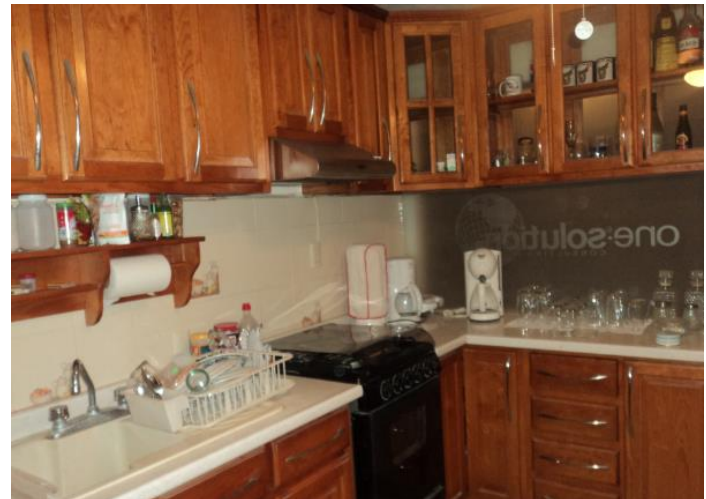
Áreas de cafetería y cocina