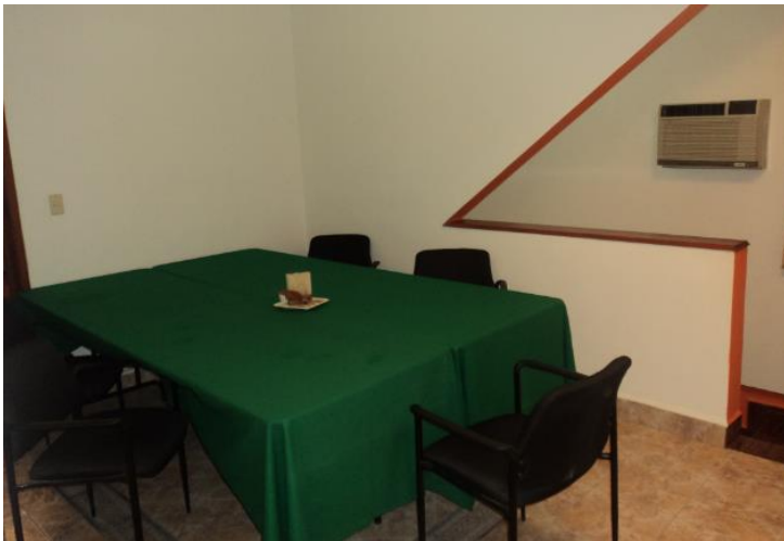
Sala de juntas o capacitación