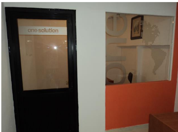
Oficina privada. Vista exterior