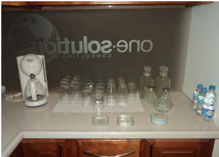
Áreas de cafetería