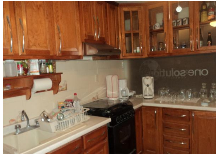
Áreas de cafetería y cocina

Firma la presente propuesta económica y de servicios: