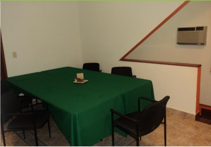
Sala de juntas o capacitación