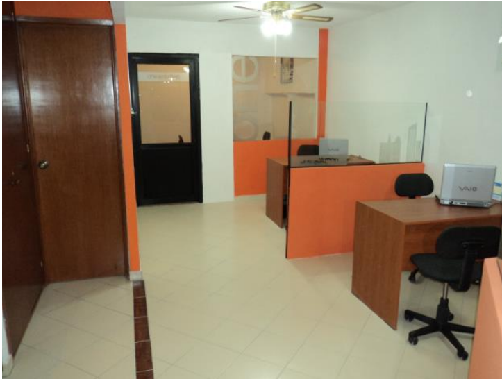
Áreas comunes de trabajo