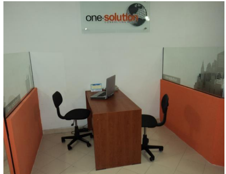
Oficina en área común No. 2