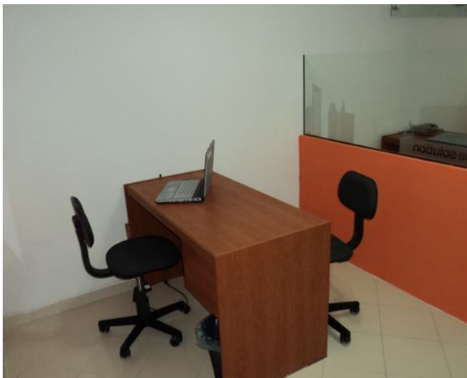
Oficina en área común No. 2