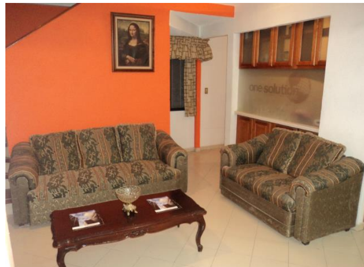
Sala de espera para clientes