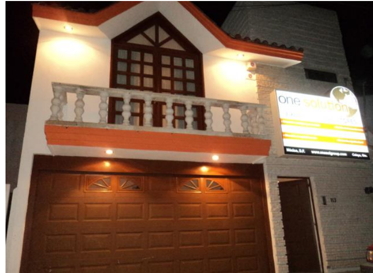
Fachada de empresa