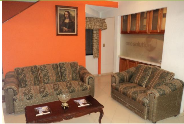
Sala de espera para clientes